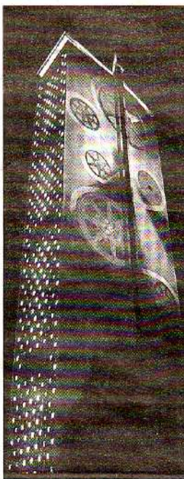
La tour des archives fait son cinéma

Mais avant tout, elle respecte des normes écologiques et limite l'impact sur l'environnement. Des critères qui, pour Neolight, étaient indispensables pour remporter le concours Lumière. « Le concours s'adresse à tous les maîtres d'ouvrage qui ont mis en lumière un ensemble qui peut être visible dans le domaine public par tous et gratuitement.